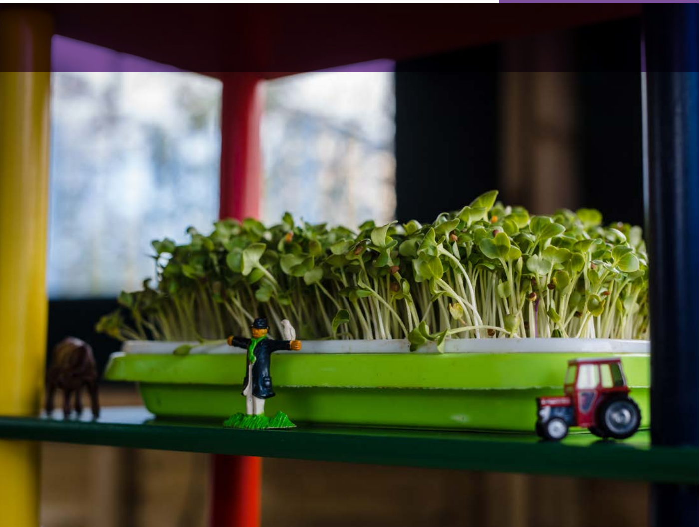
Llun: Polly Thomas